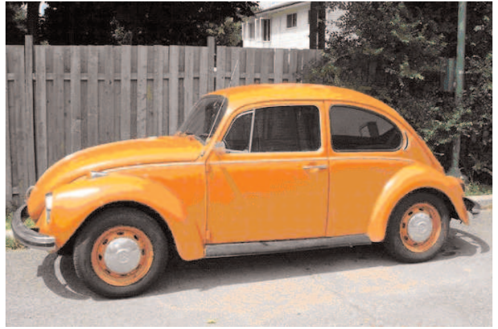
Super Beetle 1972 • Patrick Renaud

Pour cette édition nous vous présentons des voitures importées.