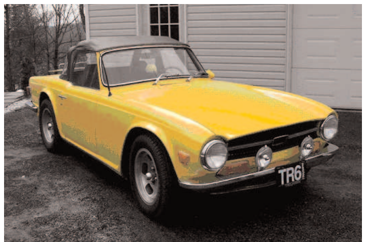
Triumph TR 6 1970 Alain Valcourt et Lee-Anne Bédard