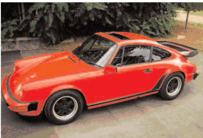
Porsche 911 Carrera 1986 • Richard Landry

En première page une Triumph TR6. Vous verrez en plus d'une autre Triumph TR6, une Volkswagen, une Porsche et une Volvo. Il s'agit d'un menu très varié. Pour les prochaines éditions nous essaierons d'obtenir le plus de photos possibles des voitures des membres afin de faire des regroupements intéressants.