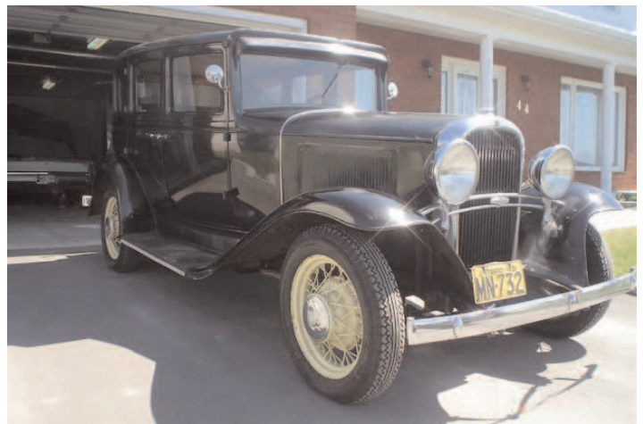
Oldsmobile 1931 Robert Hébert